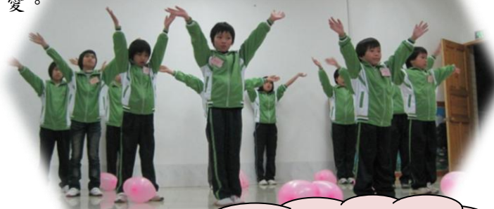
手語表演《感恩的心》

叔叔阿姨們臨別在即，我們各家舍帶著依依不捨的心情傾盡全力的在他們離開前表演朗誦、手語、唱歌、跳舞等節目，以報答他們一直以來對我們的付出及關愛。